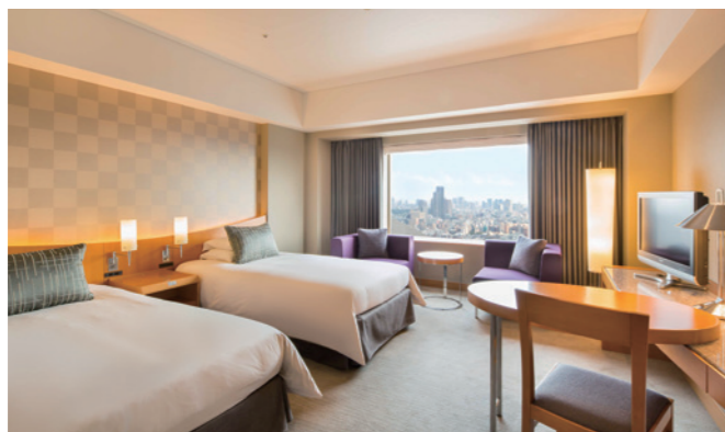
一泊ドック・一泊PETドック スーパーアツイン

https://www.tokyuhotels.co.jp/cerulean-h/room/52099/index.html