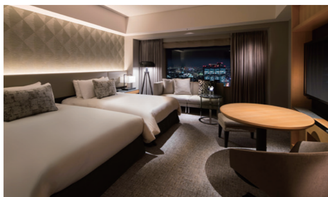
消化器精査ドック エグゼクティブフロア スーパーアツイン

https://www.tokyuhotels.co.jp/cerulean-h/room/suiteroomceruleantower/47388/index.html