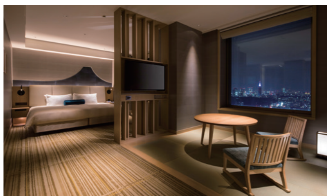
総合精査ドック スイートルーム